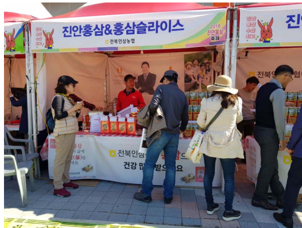
사진 2. 2018 진안홍삼축제 먹거리 부스

기 때문에 지속적으로 참여의지를 갖고 있다. 특히, 음식부스는 손쉽게 수익을 낼 수 있기 때문에 많은 참여자가 선호하는 분야이다. 한 예로, 축제에서 홍삼을 판매했던 상인은 수익이 높지 않자 음식으로 전환하여 수익을 많이 낸 경우도 있다. 이 상인은 이후에도 음식부스에 참여하고 있다. 이처럼 다양한 음식부스의 상가, 홍삼판매 부스에 참여하는 상인은 축제기간이 새로운 판로로 확보되기 때문에 상인들의 참여의지는 높게 나타난다. 37) 상인의 입장에서 판매수익은 중요한 문제가 된다. 따라서 축제를 통해 수익이 높아지면 참여의지가 높고, 수익이 낮으면 품목에 관계없이 참여의지는 떨어진다. 하지만 행정에서 필요에 따라 참여요청이 있을 경우에는 수익이 낮더라도 지자체와의 호의적인 관계를 위해 참여하는 경우도 있다.