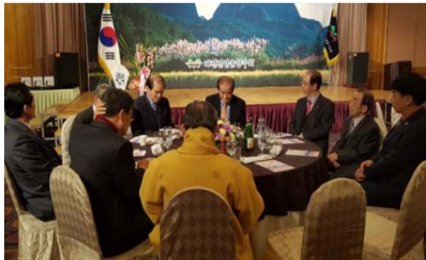
사진 1. 진안군향우회 신년인사회에 진안군수 참여 (전북일보 2017.1.19.기사)

사말을 한다. 또한 향우회와의 관계를 유지하기 위해 매년 신년 인사회를 개최하고 여러 인사들과 정치적 친분을 유지하면서 홍삼축제에 대한 홍보도 한다. 또 다른 기사에서도 “향우님들이 진안사람 어울 한마당을 열어주는 등 크고 작은 행사에 많은 관심을 가져 주셨다. 장학금도 매년 크게 내놓으셨다. 고향 진안이 희망 진안이 되는 것은 향우님들의 관심과 협력 덕분이다” 31) 라고 말한다. 군수와 향우회는 서로의 위상을 높여주기 위해 축제를 매개로 매년 자리를 함께 한다. 32)