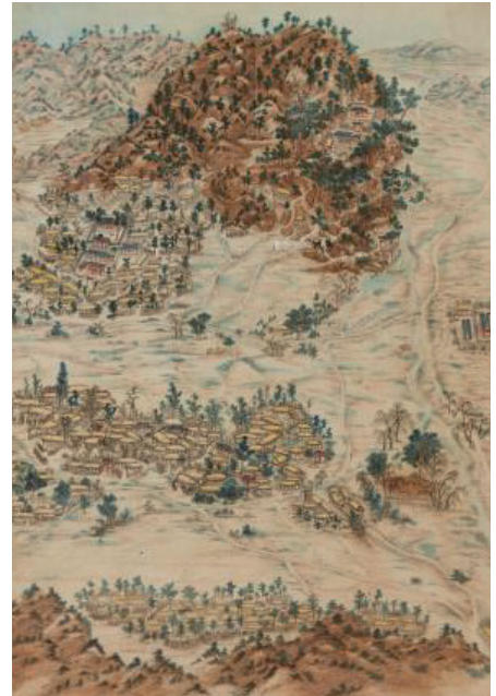
〈그림 1〉 칠광도 전경