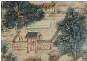
〈그림 9〉 남천사