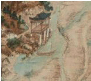
〈그림 4〉 후송정