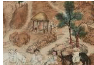
〈그림 10〉 호호정유허비