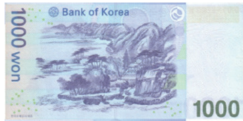
〈그림 13〉 계상정거도(천원 지폐)