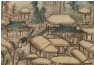
〈그림 8〉 동각(우)과 연시각(좌)