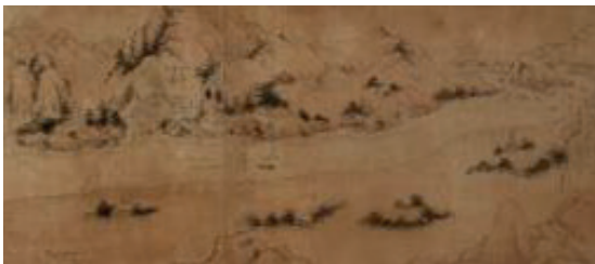
〈그림 12〉 도산서원도, 국립중앙박물관 소장 10)