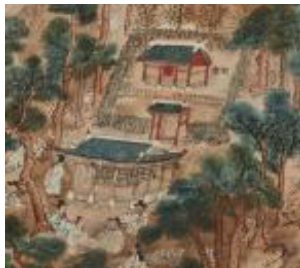
〈그림 5〉 송정과 영당