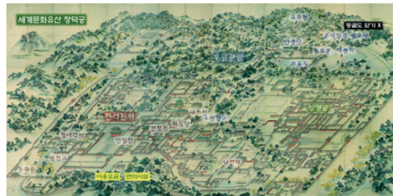
<그림 15> 세계문화유산 창덕궁