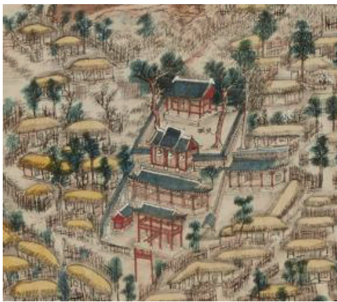
<그림 2> 무성서원 부분