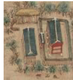
〈그림 7〉 태산사