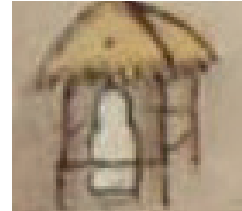
〈그림 11〉 석불입상