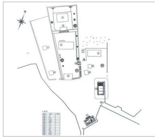
<그림 3> 무성서원 배치도 6)