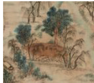
〈그림 6〉 유상대