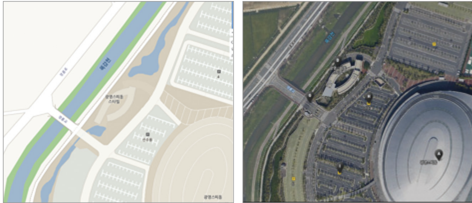
〈그림 1〉 부산시 경륜로 지정사례