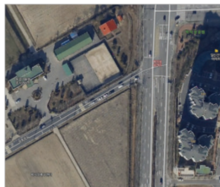
〈그림 2〉 수원시 통탄 지성로 지정사례