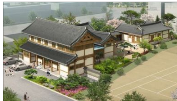
한옥 공공청사 조성 사례