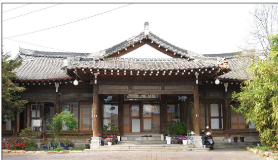
남원 광한루 주변 한옥_종가집