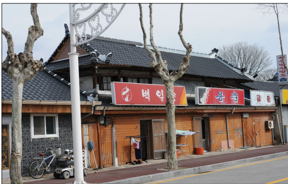
남원 저자거리 건축물 현황