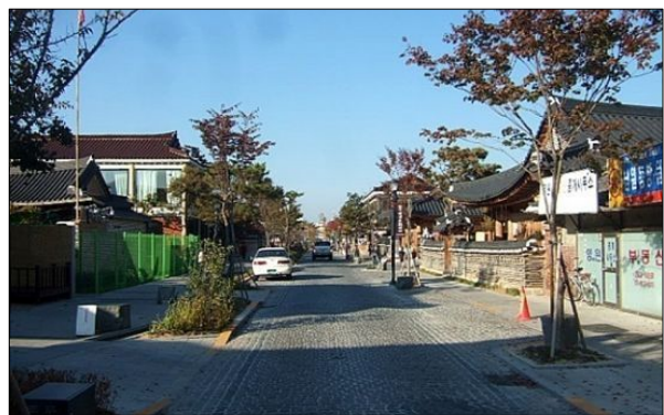
가로경관 정비 사례_전주 은행로